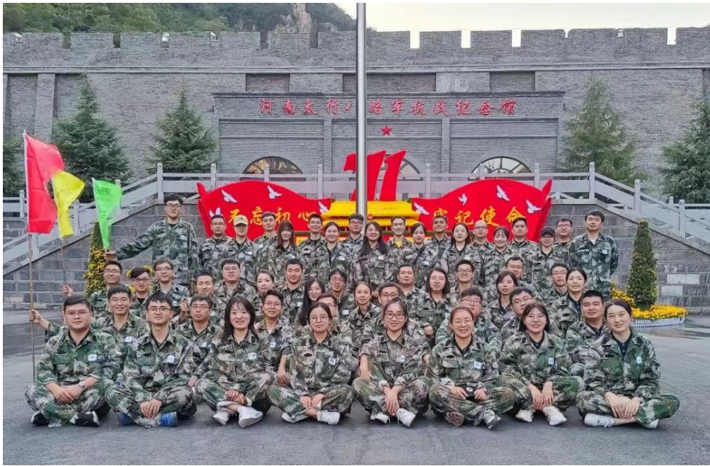
图 2 MBA 学员参观学习南太行八路军抗战纪念馆

其中河南师范大学 MBA 拓展训练是 MBA 教育中重要的一环，是 MBA 学员入学后的第一门先导课程。我校每年会组织学员在卫辉市狮豹头乡的龙卧岩拓展训练基地、南太行军事体验园等地进行户外素质拓展训练。活动中，全体 MBA 学员积极配合进行团队建设，高度弘扬团结合作精神，展现新一届 MBA 学员敢于拼搏、团结一致的优良风采。学员们共同参观河南太行八路军抗战纪念馆，通过观看英雄事迹，缅怀先烈，牢记太行精神，不忘革命先烈，践行初心使命。师生们重走长征路，拼搏登顶龙岩阁，在教官的带领下，互相鼓励，一同攀登 1391 阶陡峭的石阶，体验惊险刺激的“步步惊心”挑战桥和七彩滑道，恐惧与疲惫最终被 MBA 学员们的团结协作战胜。山顶风景独好，MBA 学员们遥望远方，纷纷表示“自我视野得到了开阔，团结精神得到了弘扬”。