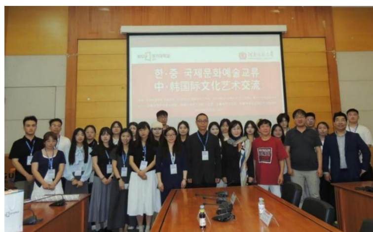
我院访问团赴韩国京畿大学艺术体育学院开展学术活动