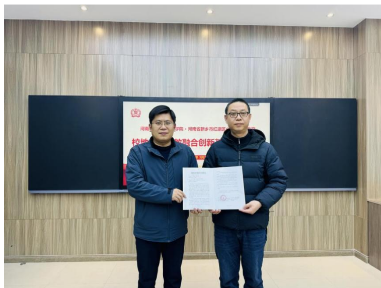
我院与新乡市红旗区小店镇人民政府举行校地合作签约仪式

学院在培养过程中突出专业特点，以实践为主兼顾理论的综合性素质培养；对学生进行系统、全面的专业训练；采用集体授课与训练和个别技能指导相结合的培养方式。积极营造艺术实践条件，建立多种类型的实践基地，保障适度学时数和学分比例的实践类课程，以保证专业教学质量。实行导师负责制，适当聘请校外高水平的艺术家参与指导艺术实践。始终坚持德育为先，将学生综合素质培养放在首位，遵循教育教学基本规律，不断探索实践德、智、体、美、劳全面发展的学生综合素质教育培养路径与方法，要求学生努力成为综合素质全面发展的新时代研究生。2025年，美术学院与多所校外实践基地签约合作。