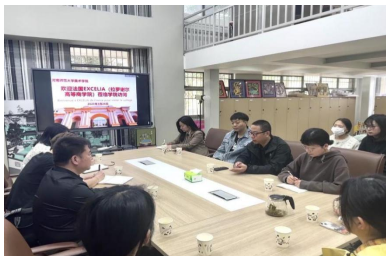
法国 EXCELIA 商学院一行访问我院

一场视觉盛宴，更是文化交流的重要纽带，促进不同文化间的艺术交融。 不断推进课程建设和课堂教学质量提升，促进教学工作高效运行。