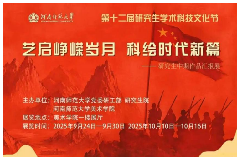
河南师大美术学院举办研究生学术科技文化节暨中期汇报展