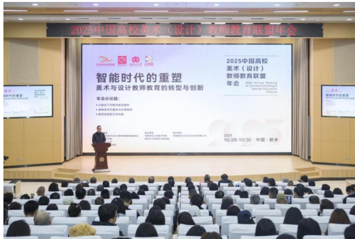
2025 中国高校美术（设计）教师教育联盟年会在河南师范大学顺利召开 河南师范大学美术学院院长陈巍教授讲话