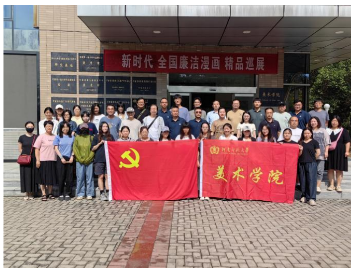
美术学院承办“新时代全国廉洁漫画精品展”