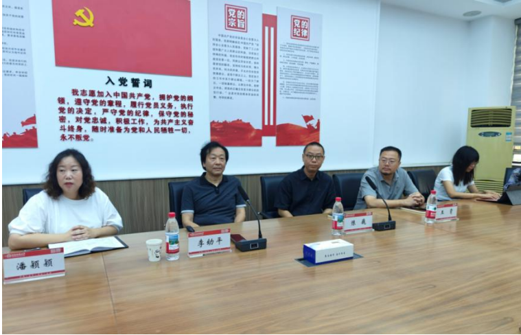
武汉音乐学院李幼平教授应邀做客美美与共名家大讲堂

术作品展览、河南省新人新作展等。学院组织师生观摩学习国家级、省级展览。同时，拓宽学术交流渠道，鼓励学生积极投稿、参展。学院内设美术展览馆，定期举办研究生中期汇报展、学术活动月作品展等，保障研究生的全面发展。以美润心，讴歌时代强国旋律。今年是我校迈向新百年征程的开局之年，在 2025 年 9 月举办的研究生中期汇报展，汇集了 2023 级、2024 级研究生的优秀成果。学生躬身实践，用画笔描绘个人成长、学术思考与艺术实践的青春画卷，镌刻出属于新时代艺术青年的美育精神力量。高校美育浸润任重道远，立足于美育强国理念，引导学生在创作中发现自我、成就自我。