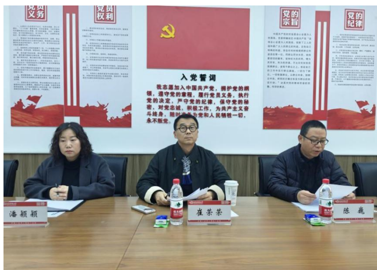
浙江理工大学崔荣荣教授莅临我院展开专题讲座

学院定期聘请校外专家学者进行学术讲座。2025年，学院从多个层面积极联系专家教授为学院学子开展讲座，如浙江理工大学崔荣荣教授、南京艺术学院顾平教授、西安美术学院、南京大学二级教授、博士生导师周晓陆老师、武汉音乐学院李幼平教授、景德镇陶瓷大学王清丽教授等。高层次、高质量的讲座，对我院研究生学术创作和研究具有极大的指导意义。