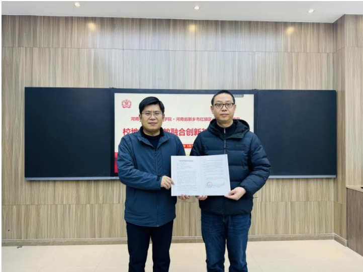
我院与新乡市红旗区小店镇人民政府举行校地合作签约仪式