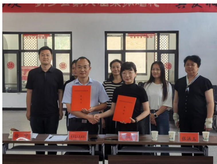
我院与新乡县人民政府对接签约

此外，学院着重举办“跨文化教学交流”活动教学，如：邀请法国 EXCELIA 商学院国际招生办主任 JULIEN 女士一行莅临我院进行文化交流、我院访问团赴韩国京畿大学艺术体育学院开展“2025 年春季中韩文化艺术交流”学术活动、开展“东方藏墨趣，世界共丹青”中外人文交流社会实践活动、开展“鉴平原古韵，品华夏文明”中外人文交流社会实践活动等。充分体现了不同国家当代艺术的多元性与创新性。为师生带来丰富的艺术体验与学习机会。这些活动的成功举办，为跨地域艺术交流注入新活力，不仅是一场视觉盛宴，更是文化交流的重要纽带，促进不同文化间的艺术交融。不断推进