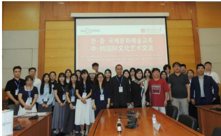
我院访问团赴韩国京畿大学艺术体育学院开展学术活动