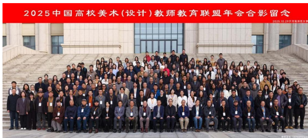
2025 中国高校美术（设计）教师教育联盟年会在我校顺利召开