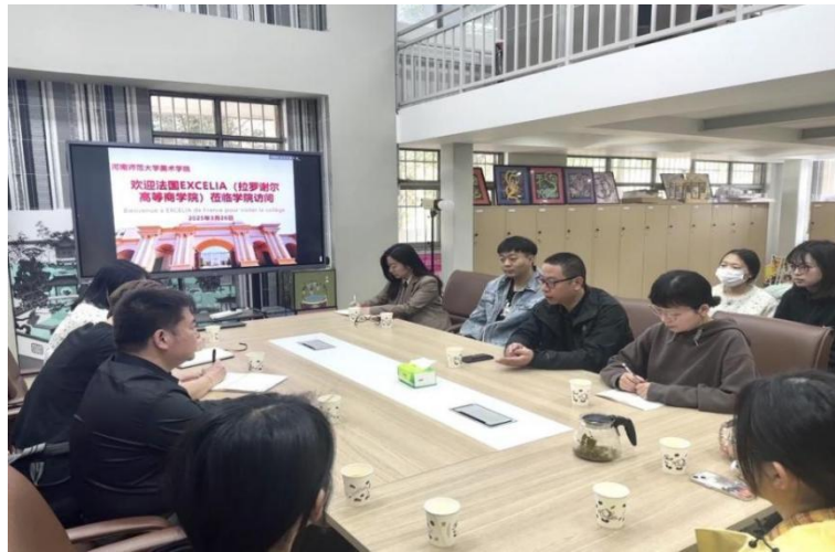
法国 EXCELIA 商学院一行访问我院