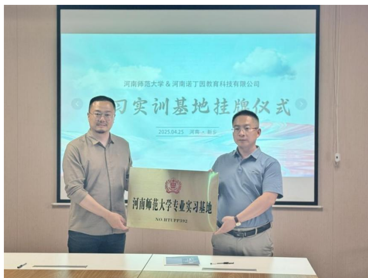
我院与河南诺丁园教育科技有限公司签约授牌