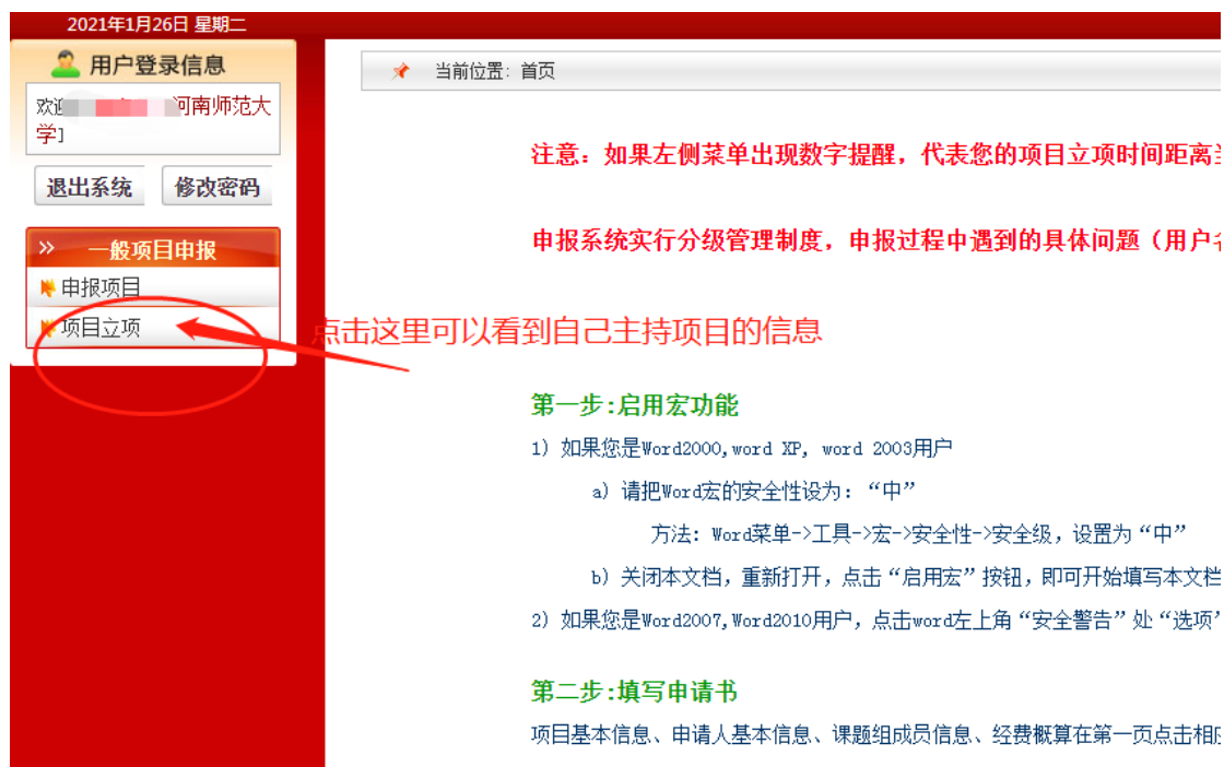
(图 7) 界面左上角可查看自己的项目信息