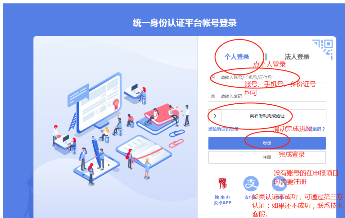
(图 2: 申报人登录界面 2)

结项时间: 项目立项后, 达到结项要求, 即可在系统上提交结项材料。不再另外通知。