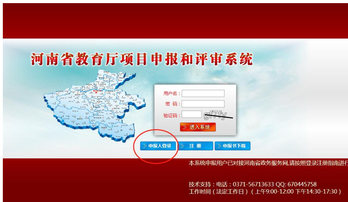
(图 1: 申报人登录界面 1)

前该系统已经集成了项目申报、项目变更、项目结项和结项证书打印等功能, 日趋完善。