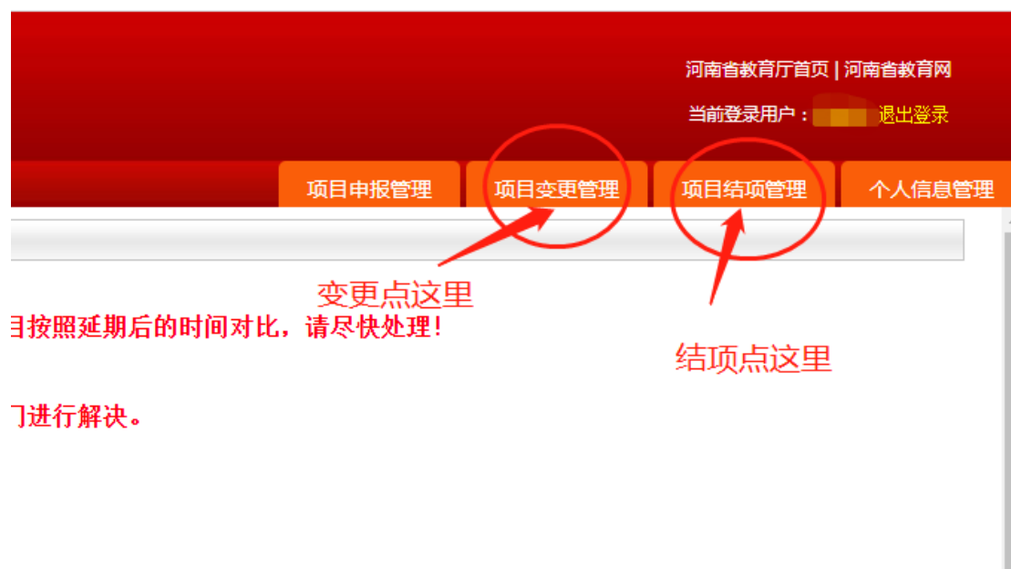
(图 8) 界面右上角有相应的管理栏目