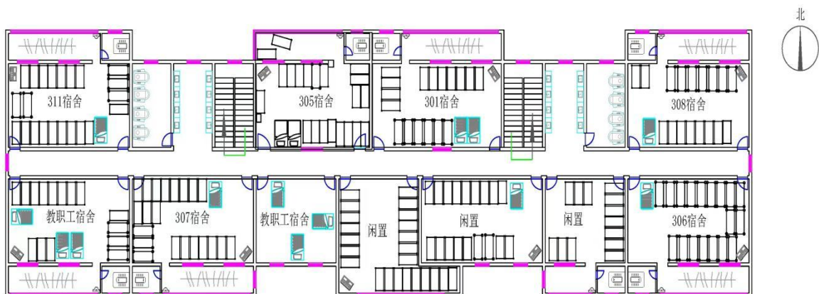
图 3 起火建筑三层平面图

起火建筑共有空调、照明 2 路供电线路，其中照明线路进入每层楼梯间配电箱后，分别给照明灯、插座供电。